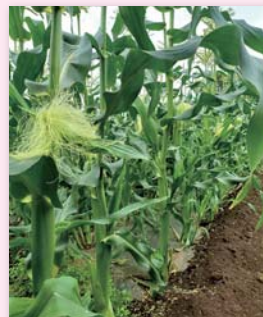
生分解性マルチで栽培中のトウモロコシ

トウモロコシは15年ほど前までポリマルチを使っていた。「マルチを剥がす前に残茎を1本1本抜き取る作業が大変で、トウモロコシは作るのが嫌いな作物だった」。直売の仲間と収穫後の残茎を粉碎するハンマーナイフモアを共同購入した時に、「生分解性マルチを組合せたら便利になるのでは」と考え、試した。その結果、残渣処理とマルチのすき込みが上手くいった。それ以来、生分解性マルチを使っている。