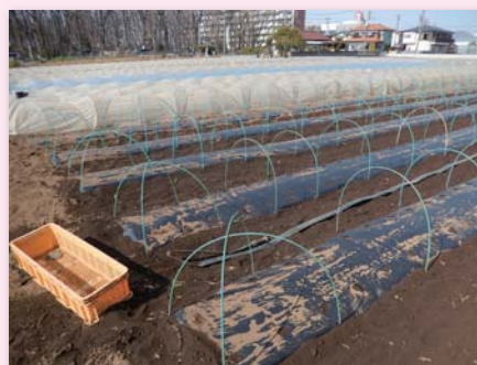
トウモロコシ圃場

トウモロコシは収穫後の片付けが楽になったので、作付け本数がポリマルチ時代の2,000本から今年(2022年)は3万本まで増やした。収穫したその日に残茎をハンマーナイフモアで粉碎して、2～3日したら1度耕耘する。その1週間後に2回目の耕耘をしてマルチを敷き、枝豆を定植する。収穫から早ければ1週間、10日後には次の作物を植えられる。