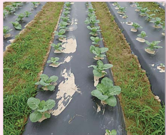
生分解性マルチを張った畝に定植