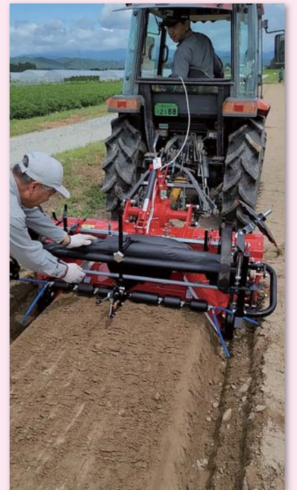
生分解性マルチの展張