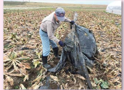
ポリマルチはがし

また、生分解性マルチの原料の多くは石油でできてると聞いているので、植物性の原料や国内で調達できる仕組みづくりもすすめてほしい。