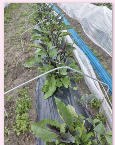
長期に収穫し反収の上がるナスでは使うメリットが大きい