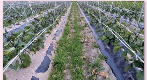
生分解性マルチ(左)とポリマルチ(右)を隣接畝で比較

ナスに関しては生分解性マルチだけで十分です。ただし反収が上がる作物でないとメリットが出ない。ナスは去年使ってよかったので、今年も使おうと思って種苗店に言うと、在庫を持ってないので、ロットが集まらないと作れませんと言われた。使う人が増えれば、普通に買えるようになるので、皆さんに使ってもらいたいと思う。