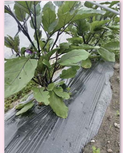
生分解性マルチを張ったナスの畝