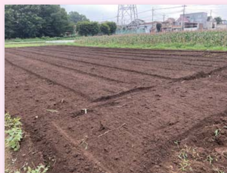
トウモロコシを収穫後、生分解性マルチと一緒にすき込んだ圃場

生分解性マルチがもっと使われるようになるには、野菜の価格が上がるのが一番。原材料費が高くなっても、現状は販売価格に転嫁できない。生分解性マルチを使おうか、ポリマルチにしようか迷っている作物でも、価格が上がる見通しがあれば、資材費が掛かっても生分解性マルチを使って面積をもっと増やしたい。